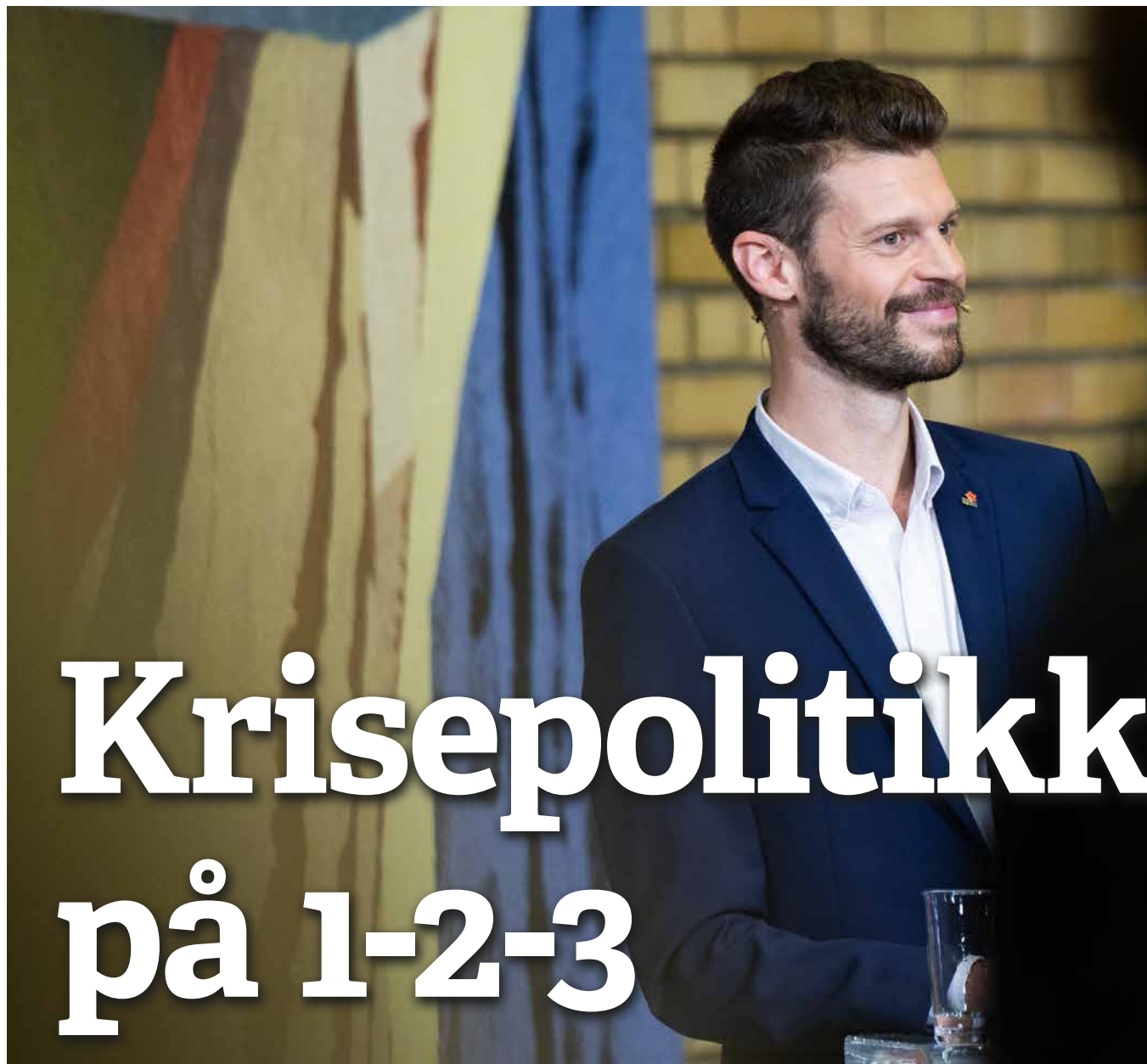
Krisepolitikk: Rødt jobber for rettferdige krisepakker for folk flest.

Utgiver: Rødt Dronningens gate 22 0154 Oslo