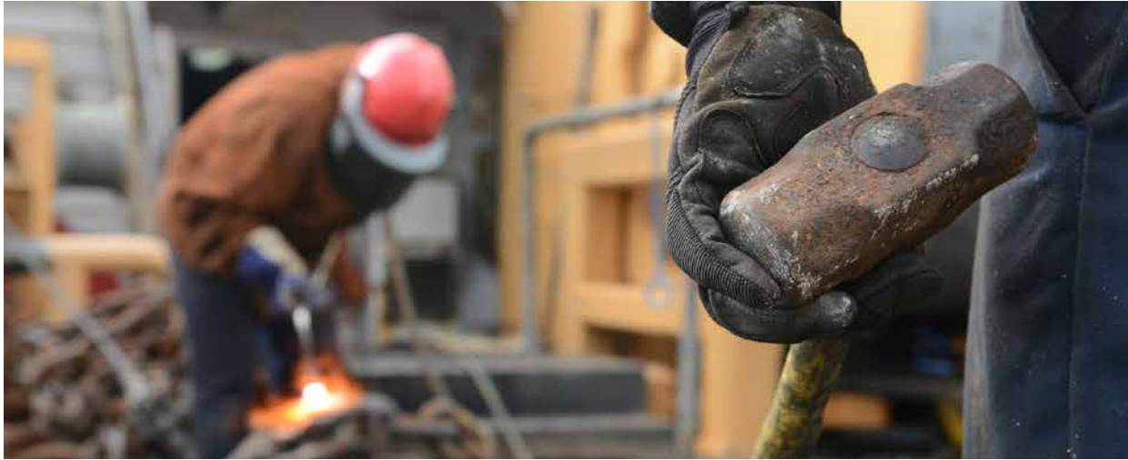
Trenger folk: Bygg- og anleggsbransjen.