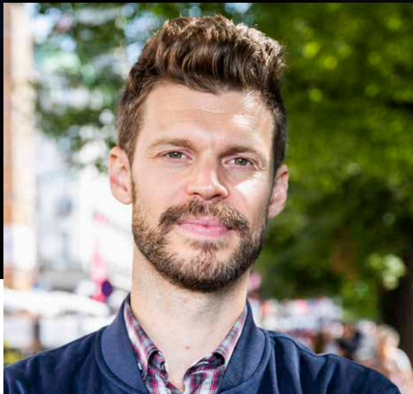
Rødt-leder: Bjørnar Moxnes.

– Mange bedrifter, som frisørsalonger og hoteller, inngår i konsern og andre former for avanserte selskapsstrukturer. Det gjør at utgiftene kan ligge ett sted, mens profitten ofte har finner veien ut helt andre steder. Tidligere har dette gjort at det ikke har vært mulig å få skikkelige lokale lønnsoppgjør for de ansatte, selv om eierne har fått rikelig fortjeneste. Derfor må det stilles krav om at krisetilskudd skal komme det enkelte hotell eller frisørsalongene som sliter til gode, ikke kunne skjermes hos eierne og hentes ut som framtidig