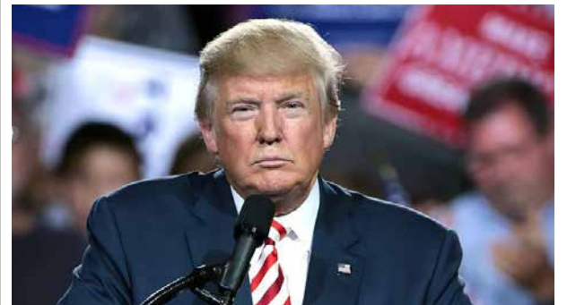
Kniper igjen: Donald Trump stopper alle utbetalinger til Verdens helseorganisasjon.