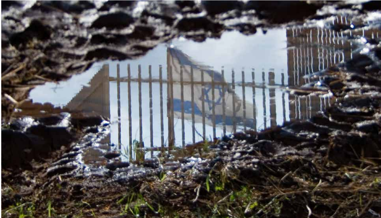
Får kritikk: Israel fortsetter ødeleggelsen av palestinsk infrastruktur.