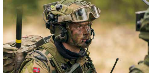
Forsvaret: Kan rammes ved redusert økonomisk vekst.