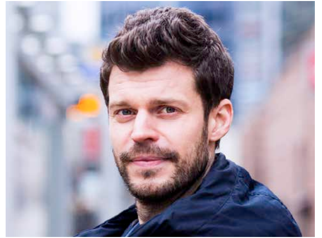
Rødt-leder: Bjørnar Moxnes.