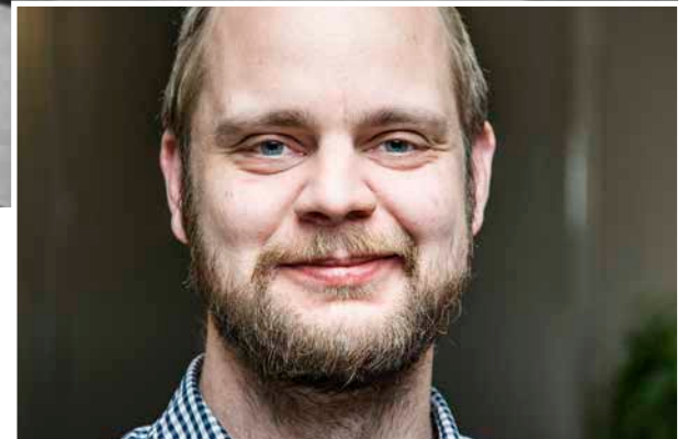
Forfatter: Mimir Kristjánsson.

En mann å lære av: Martin Tranmæl taler på Youngstorget i 1937.