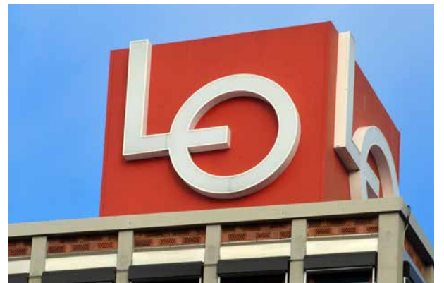
Vokser: LO opplever sterk vekst.